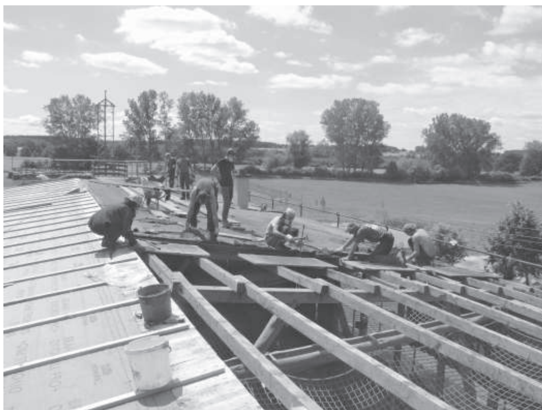
La vie est un chantier permanent: ici, rénovation du toit de la vieille grange à Ulenkrug.

(4) AMAP: Association pour le maintien de l'agriculture paysanne (5) Dans ce cadre, Radio Zinzine a démarré une série d'émissions, «Entre cimes et racines», réalisées en partenariat avec le réseau. Les sept émissions produites jusqu'à présent peuvent être commandées sur CD MP3 auprès de Radio Zinzine, F-04300 Limans (10 euros, frais d'envoi compris). Elles sont également disponibles sur le site de Reller.