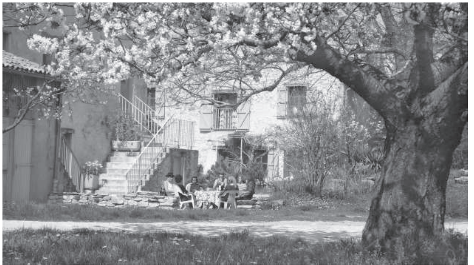
Quoi de plus délicieux qu'un repas partagé sur fond de cerisier en fleurs?

Les étudiants paysagistes de l'École de Versailles (une soixantaine) sont venus comme chaque année au mois de juin pour y effectuer avec beaucoup d'enthousiasme leur stage pratique. A la fin de l'été a eu lieu une grande rencontre d'une semaine sur les media libres avec des journalistes, des animateurs de radios libres et autres, venus de France mais aussi d'autres pays. Ils ont pu parler de leur expérience, de la situation actuelle et des difficultés à survivre à une époque où l'expression libre est de