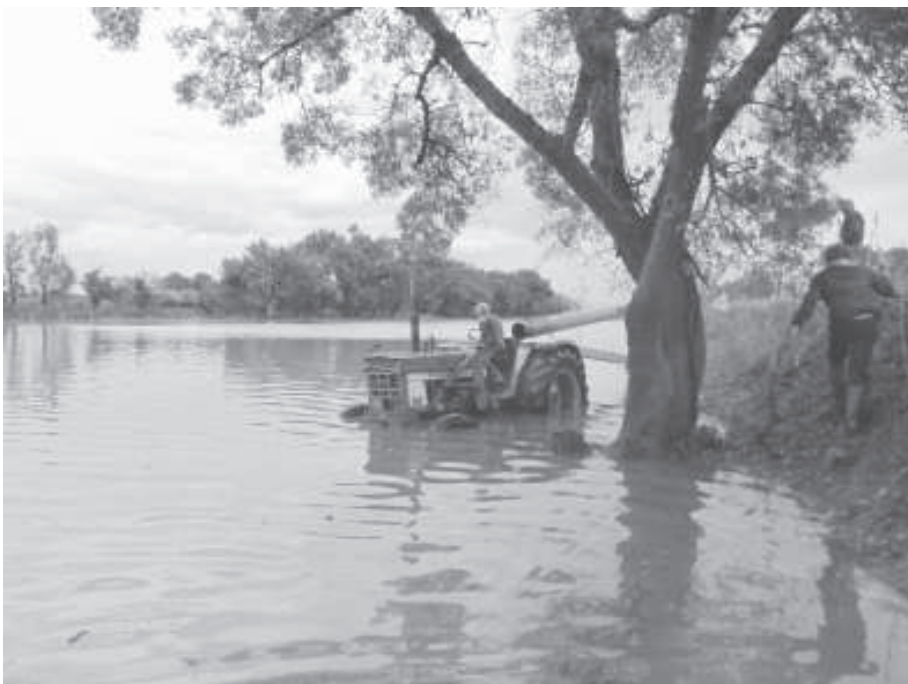
C'est risqué, mais on doit pomper l'eau des champs!