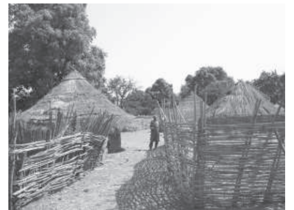
Le village de Falea